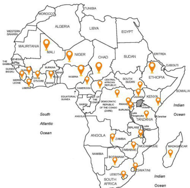
A Map showing ACHAP footprint across sub-Saharan Africa.

Empowering Faith-Based Health Systems for a Healthier Africa