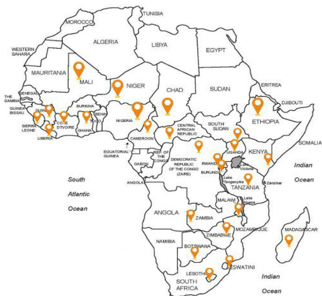
Une carte montrant l'empreinte d'ACHAP à travers l'Afrique subsaharienne..

Renforcer les systèmes de santé confessionnels pour une Afrique en meilleure santé